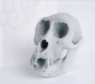
ニホンザル頭蓋骨 (人類学ミュージアムより)