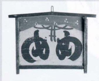
向い目絵馬 (烏山民俗資料館より)