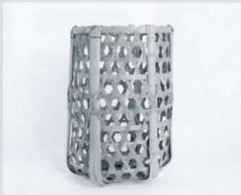
目籠 (豊北歴史民俗資料館より)